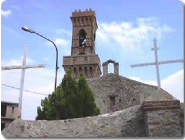
(Campanile Chiesa del Carmine)