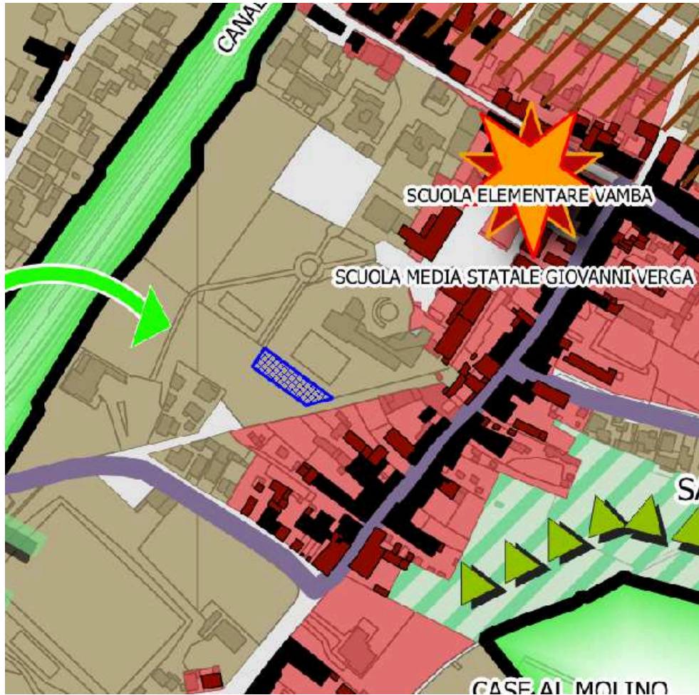
Estratto P04 - LE STRATEGIE DELLO SVILUPPO SOSTENIBILE - LE STRATEGIE COMUNALI (29.85 MB)

PS _ Per il Piano Strutturale vigente, approvato con Delibera Consiliare n. 221 del 28.10.2021, l'area ricade all'interno del perimetro del territorio urbanizzato, è classificata nella tavola P04 - LE STRATEGIE DELLO SVILUPPO SOSTENIBILE - LE STRATEGIE COMUNALI come "Aree urbane da consolidare e riqualificare" e fa parte dell'UTOE 3.