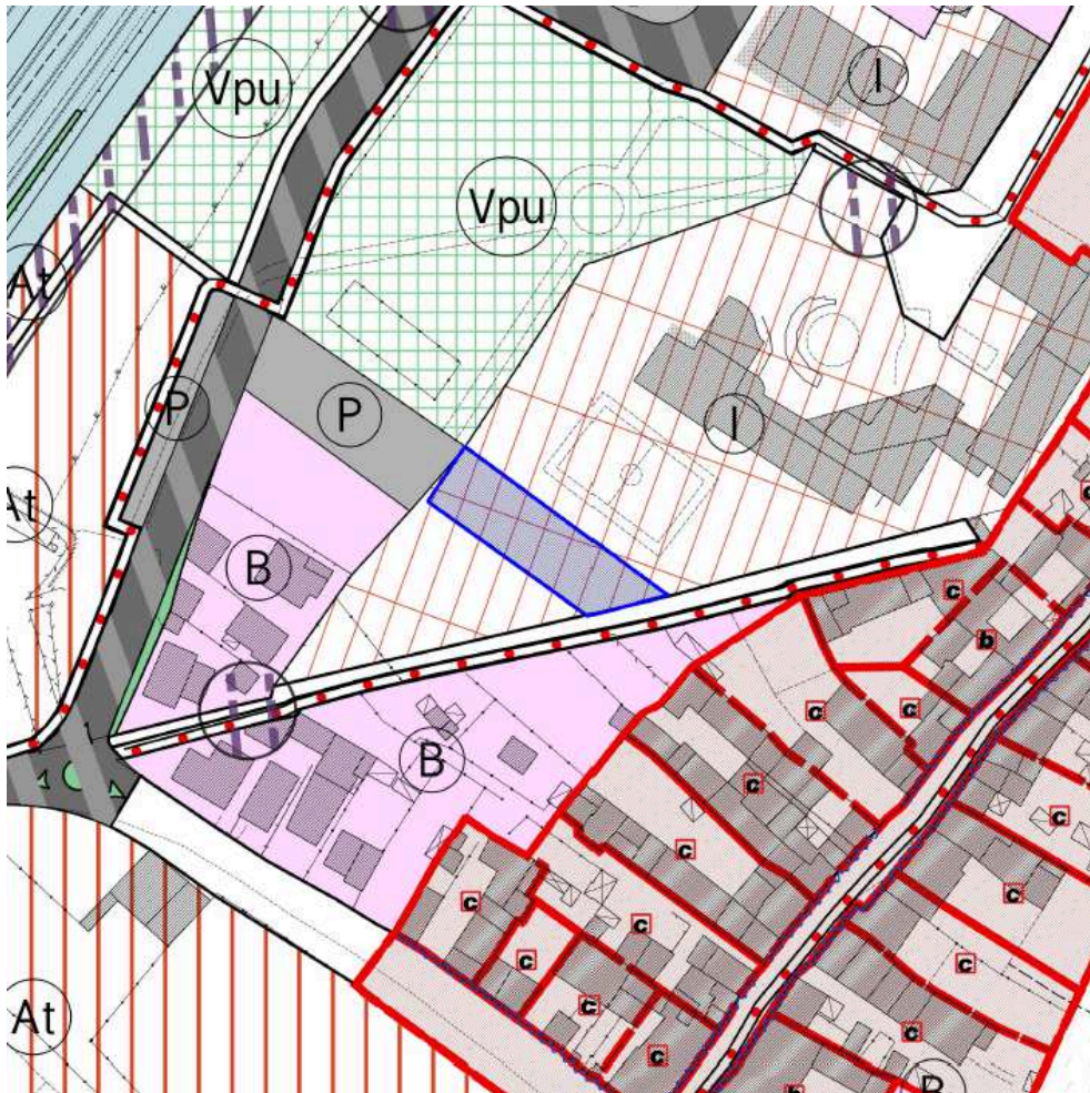
Estratto RUC vigente Tav. 26-27

RU _ Nel Regolamento Urbanistico vigente, l'area ha destinazione urbanistica I - "Aree per l'istruzione", art.135 delle NTA.